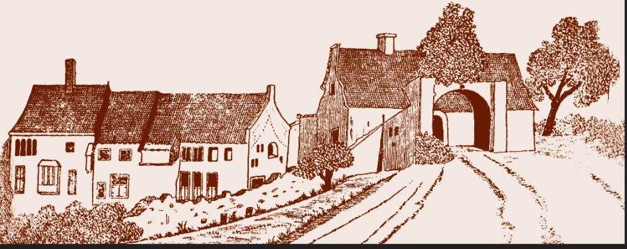
Havezathe Plekenpol, Woold

Overzicht van de scholtenboerderijen rond Winterswijk. De meeste scholten-goederen liggen in Ratum en in het Woold, uitlopend naar Miste en Haart. In rood aangegeven zijn de havezathen en scholtengoederen die in 1810 aanwezig waren. Dit zijn globaal ook de boerderijen die aan het eind van de Middeleeuwen als "scholte" zijn aangewezen. Verder zijn enkele boerderijen aangegeven, die in de 19e eeuw scholtengoed zijn geworden; dit overzicht is hier nog niet volledig.