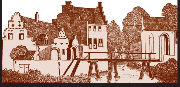
Havezathe het Waliën, Huppel